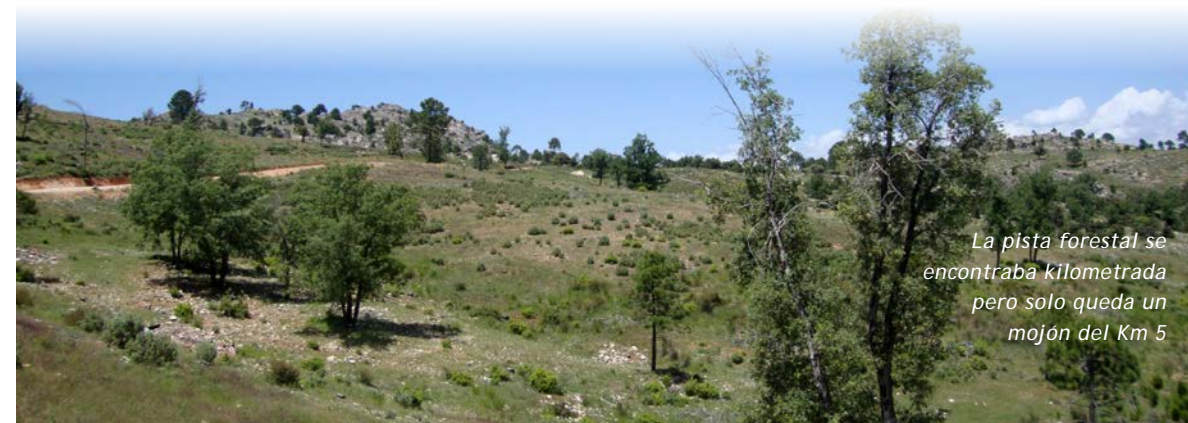
La pista forestal se encontraba kilometrada pero solo queda un mojón del Km 5

La pista continúa recorriendo toda la altiplanicie de la Albarda, rodeados de grandes cubres y barrancos, dejándonos muy claro la gran extensión de este espacio protegido. Para los más curiosos, seguiremos caminando hasta llegar a un lugar llamado ojo del Agua de los Perros, un cráter por donde el agua de lluvia cae hacia una enorme cueva natural que está debajo, conocida como la Iglesia de los Perros. En este lugar el agua y el viento producen fenómenos que dependen de la época del año.