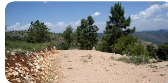
El río Guadalentín labra un gran cañón a los pies de cumbres de más de 2000 metros

auténticas avenidas de agua. Continuamos nuestro camino por la serpenteante pista forestal hasta llegar a lo más alto [4] de toda la ruta, 1.381 metros.